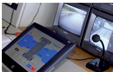
Video software integratie met de afstandsbediening systeem van de bruggen en sluisen (SCADA systeem)

Wanneer de uitgestuurde radio signalen van een schip op het kanaal door verschillende radio's worden ontvangen zullen de respectievelijke radio's elk een audiosignaal genereren dewelke via het IP netwerk naar de centrale site wordt gestuurd. Gezien er faseverschuivin-