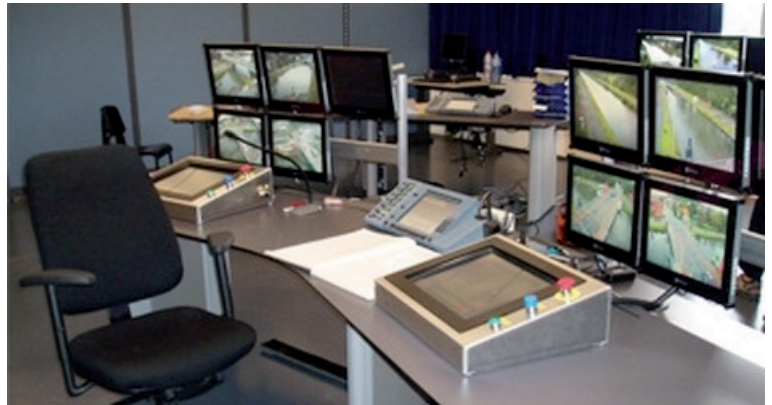
Er zijn twee verkeersposten gebouwd: in Willebroek (Zeekanaal Brussel-Schelde) en in Kampenhout (kanaal Leuven-Dijle).

gen kunnen optreden kan het gemixte audiosignaal onverstaanbaar worden op de luidspreker van een operator.